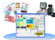
(券作くんタッチパネル販売画面)