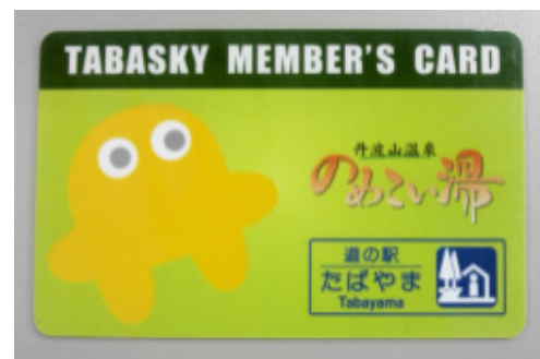
新しくなった会員ポイントカード

今年5月に温泉へのリピート利用促進を目的に、施設初となる会員へのDM発送を行いました。このキャンペーンは「DMを持って来館されたお客様にボーナスポイントを付与」するものだったのですが、DMの反応率(発送数からみた利用数)は、10%を超え、これに伴い温泉収入が予想を超えるほど大きく増加しました。なにより、DM呼びかけで、これだけ沢山のお客様に再来して頂いたことは、今までの努力が少しお客様に認めて頂いたようで施設にとっても自信になりました。今後は、来場の多いお客様向け、疎遠になってしまっているお客様向けなど、利用層に応じたキャンペーンを実施して、施設利用を呼び掛ける予定です。