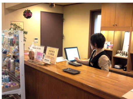
丹波山温泉 のめこい湯フロント