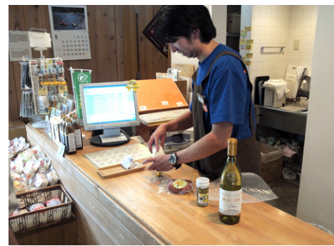
道の駅 たばやま 農林産物直売所

今回のシステム更新に伴い、レジでの販売実績が在庫状況とデータ連携するようになりました。また在庫データは事務所で確認の上、発注書の作成までシステムで一貫して行えるようになりました。これによりスタッフは在庫管理、発注業務から解放され、接客対応や店内整頓に集中できるようになりました。